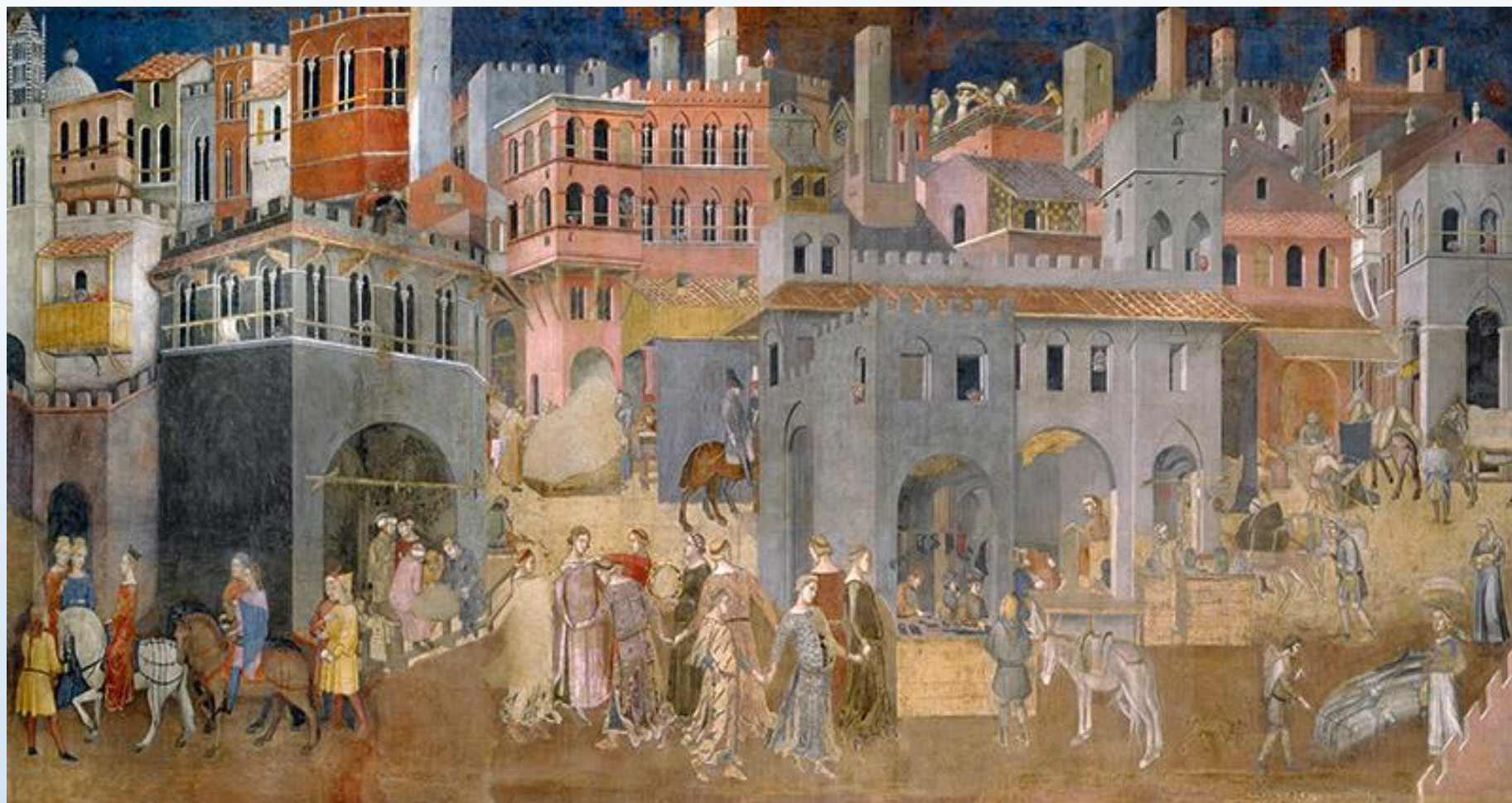
Effetti del buon governo, Ambrogio Lorenzetti, Siena, 1338